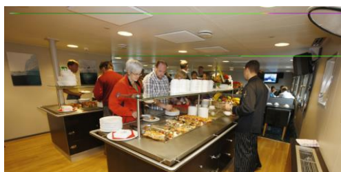
BUFFET AREA DINING